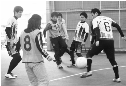
熱戦を展開したフットサル大会=3月17日

3月17日、他市町村とのスポーツ交流を目的に、今年で10回目となるフットサル大会を豊橋市・神野インドアで開催しました。各チーム代表者が審判や運営を担う恒例のイベントです。参加した7チームの選手・応援団約130人以上が、親睦競技の各リ