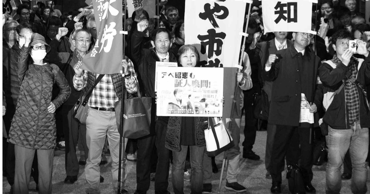
昨年を上回る賃上げを求め、引き続き奮闘しようとした労働者決起集会 = 3月15日、若宮広場で