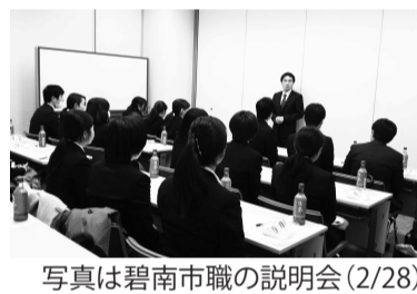
写真は碧南市職の説明会(2/28)

員が職場に配属されま。説明会で未加入だった新人職員にさらに声をかけをし、加入を訴えています。春日井市職労は実行委員会を結成して準備をしています。