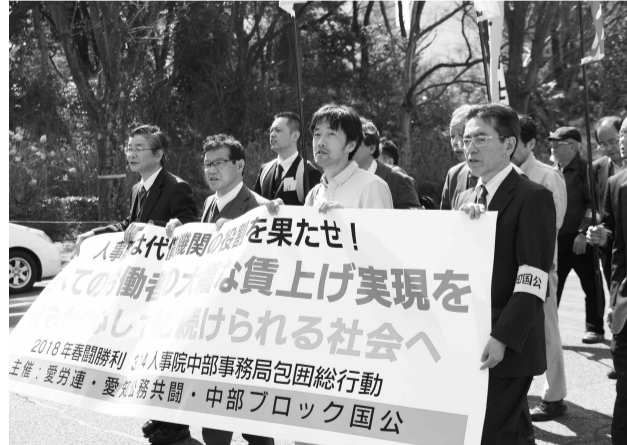
愛労連・愛知公務共闘、中部ブロック国公主催の人事院中部事務局包囲行動が行われ、約40人が参加した。 = 3月14日、第2合同庁舎前