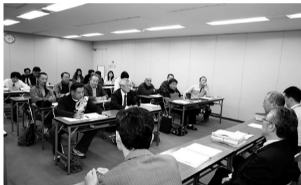
要求の実現を迫る交渉団/春日井市職労

豊川市病労組は11月11日の交渉で、夜間看護手当の改善をかちとりました。近隣の病院と比較して低いため、改善を申し入れるなかで実現しました。長夜勤務1回7500円を8200円に、深夜勤務3800円を4300円