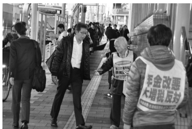
「新瑞橋」バスターミナルで早朝宣伝

に繰り広げました。瑞穂区の地下鉄「新瑞橋」駅前でピラを受け取ったある会社員は「サービスマンを法的に規制してほしい」と話しました。