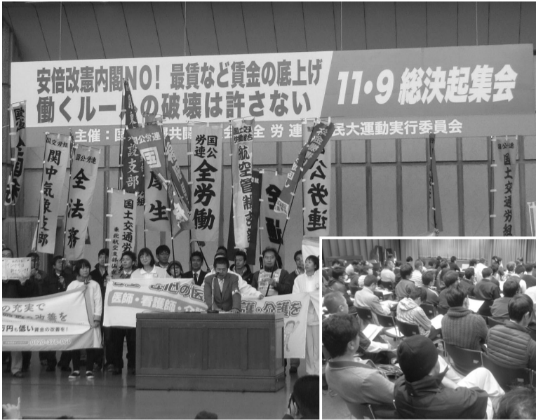
日比谷野外音楽堂に1700人/11・9中央行動 各職場から団体交渉に参加/豊橋市職労