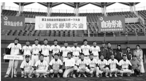
勢揃いする豊橋市職労チーム

自治労連全国野球大会が11月21日、23日にかけて滋賀県で開催され、豊橋市職労チームが準優勝し、惜しくも三連覇はなりません。 初戦の相手は、愛媛の松山市職労チーム。1点を争う好ゲームでしたが、6回表の追加点を守り切り4-3で勝利。準決勝は攻守のリズムもよく終始リードを保ち、所沢市職労チーム(埼玉)に6-2で快勝しました。 迎えた決勝戦の相手は、宇部市職労。この試合で初めて先行を許した豊橋チームは、4回を終わって1点差まで詰め寄りましたが、結果は1-4と惜しくも準優勝でした。来年の雪辱、優勝が楽しみです。