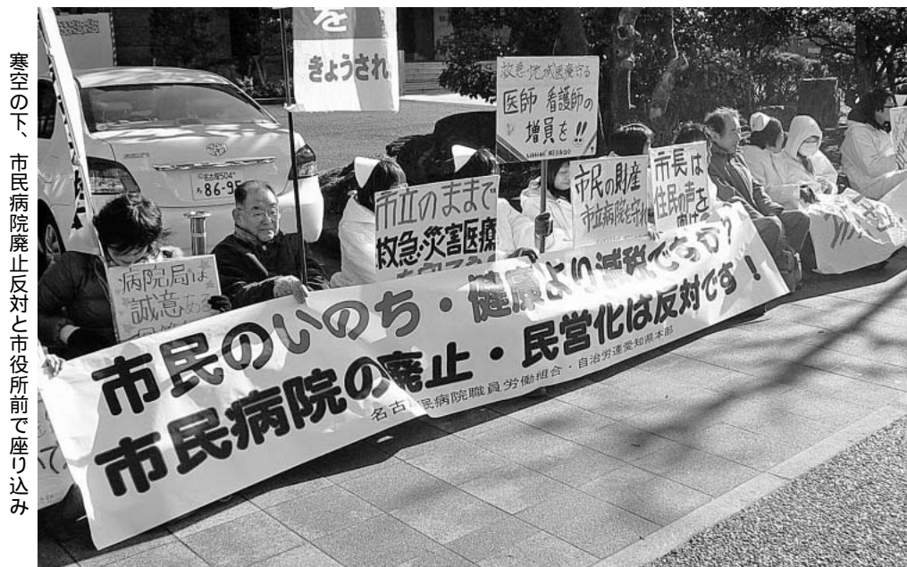
寒空の下、市民病院廃止反対と市役所前で座り込み

仲習を増やし職場を変えよう 自治労連あいち組織集会 とき・2月20日(土)~21日(日) ところ・蒲郡・形原温泉「鈴岡」