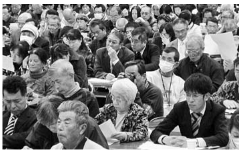
会場をつめつくす参加者

1月13日、革新市政の会や市民犠牲許すな連絡会などが主催した「市民集会」では、実行委員会から河村