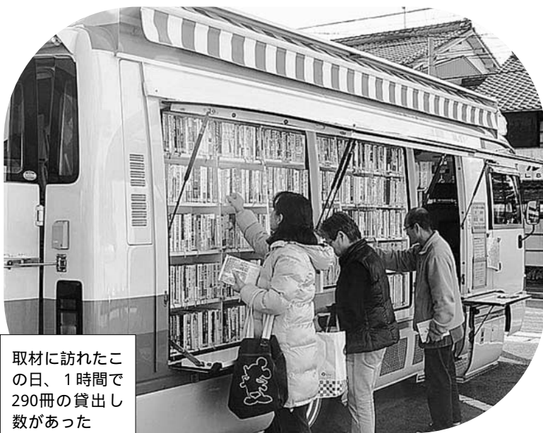
取材に訪れたこの日、1時間で290冊の貸出し数があった

河村名古屋市長の言う「市民税10%減税」は、金持ちのための減税。「地域委員会」や「議会改革」と称した、河村流「構造改革」。福祉切り捨て、民主主義破壊を許すなど、1月13日、800人を超す市民が決起集会を開催。1月7日と21日には、城西病院廃止反対をきっかけ名古屋病院労組などが市役所前での座り込み。さらに、名古屋市職労教育委員会事務局支部は自治労名古屋教育支部と組合のちがいを超えて自動車図書館の廃止を許すなど共同のたたかいを広げています。