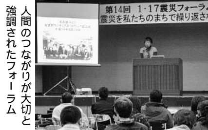
震災に強いまちづくりをめざす「第14回1・17震災フォーラム」が16日、名古屋市内の労組や消防職員組織、公共事業や住宅関連組織など70人が参加しました。