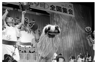
オープニングの六斎念仏踊り

10月18日~19日、京都市で自治労連や市民団体など21団体がつくる実行委員会主催で、「打ち破ろう」構