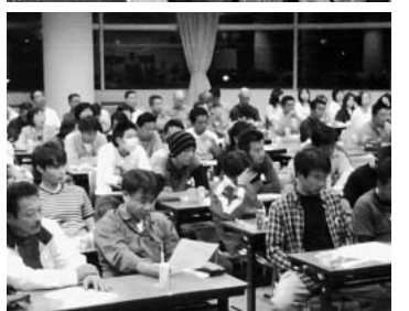
上・名古屋市職労 下・春日井市職労