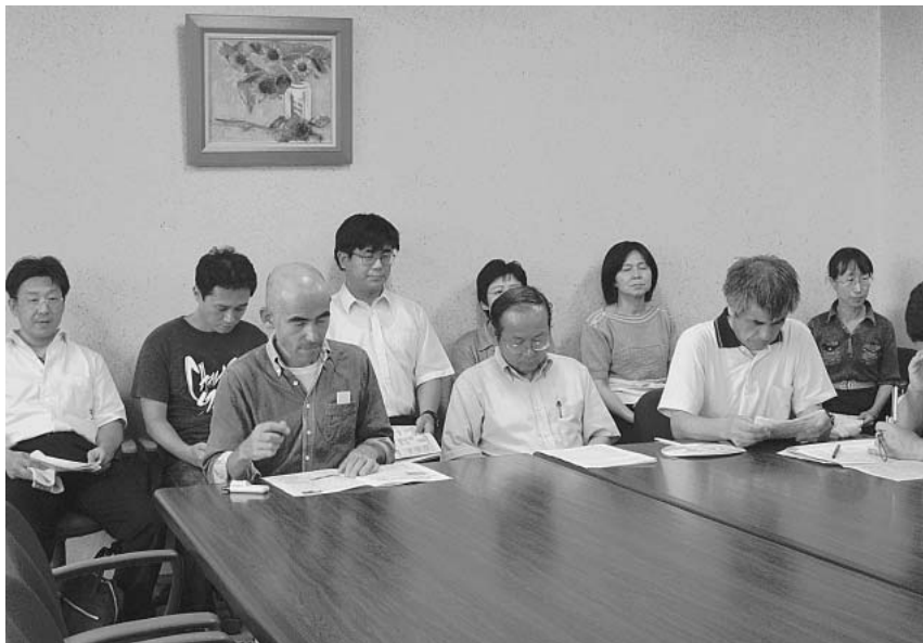
学事労単独の人事委員会要請を実施