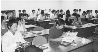
役所の仕事について学ぶ若手組合員みなさん

7月11日(水)、就職して3年目までの、豊橋市役所の将来を担う若手職員を対象に、「夏学・市役所の仕事って何?」と題して学習会を開催し53人が参加しました。