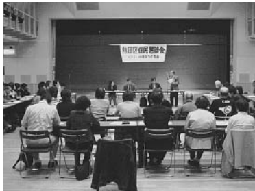
6月29日、区行政の最高 責任者である熱田区長と