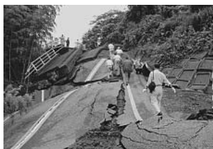
道路が大きく陥没する。 地震の大きさがわかります

7月16日午前10時13分 頃、柏崎市沖を震源地と したマグニチュード6・ 8の「新潟県中越沖地 震」が発生しました。こ の地震により、柏崎市や