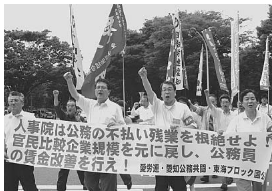
人事院中部事務局を包囲するデモ行進