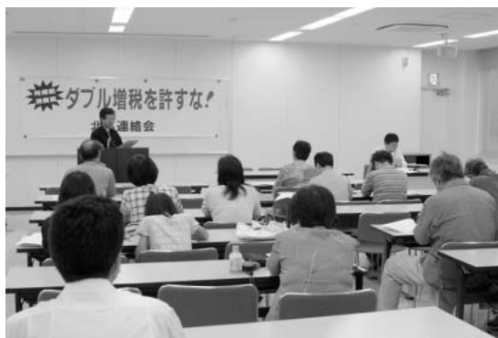
税源移譲と住民税、国保・介護など 北区役所の仲間が住民に説明 (壇上は大矢名北労連事務局長)

名北民商から、住民税の増額に関して6月中旬に学習会を開き、名北労連に要請がありました。重税