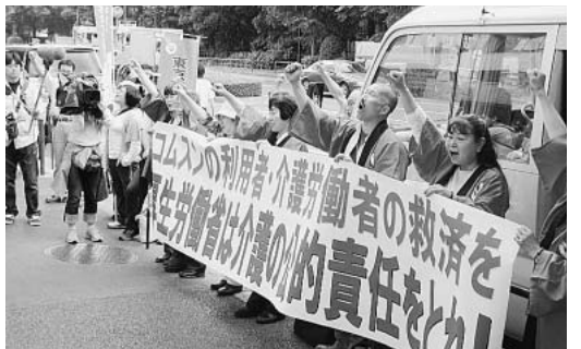
厚労省前でコムスン問題で緊急要請し、マスコミ各社もつめかけました

のとりくみと保育のつどい(佐久)、「子供に豊かな保育を上田連絡会」(上田)、「住民との共同、民営化とのたたかいと保育まつり」(長野)の特別報告をうけ、翌日は保育士の働き方、非常勤職員の交流の二つに分かれて交流。帰りには無言館などのオブショナルツアーで楽しみました。