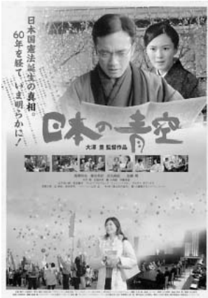
「日本の青空」上映日程 (4.16現在)