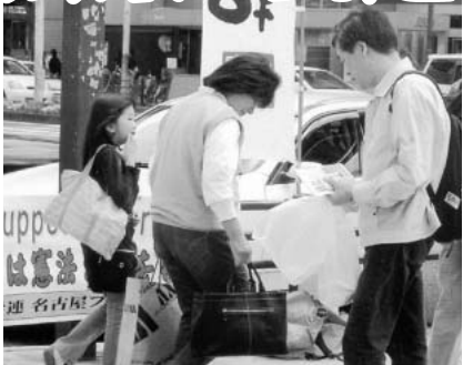
名古屋ブロックもいっせいに地域宣伝にとりくみました

自治労連は満身の怒りを込めて採決強行に強く抗議するとともに、参議院段階で必ず廃案に追いこむため