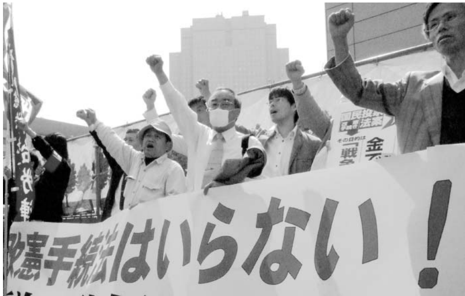
4月12日、国会前で強行採決するなどアピールする愛知の代表団