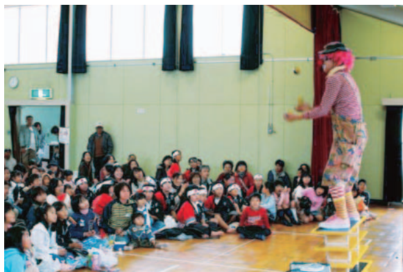
大道芸人のパフォーマンスにうっとりする子供たち

「うんすね!」と声をかけてくれました。そして話そうに話そう。他の子どもは、「ピエロさんたちの大道芸やジャグリングを初めて見たのでびっくりした。おもしろかった。太鼓もかっこよかったです。たくさん企画があつた。いろいろな遊べたから楽しかった」と、遊びきる楽しさを語る子どもたちの姿がありました。市職労保育部会も、子どもまつり実行委員を選出