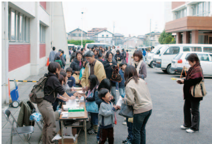
ぞくぞくと受付に並び子どもまつり参加の親子連れ「わくわくする子どもまつりの始まり」

感謝の日に行われ、会場となった春日井市中央公民館・儀田公園には開会の10時前から親子連れの参加者が続々とつめかけ、この日一日で1000人が秋の一日を楽しみました。今回の企画は、定番となった「スライム」(子どもたちに大人気)や「プレート」(プラスチックの手作りプレート)、「小麦粉粘土」(例年春日井市職労の保育士部会が担当)、「折り