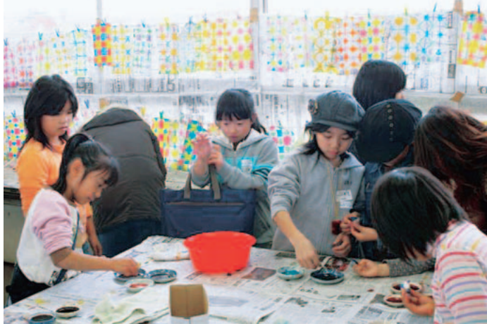
机の上で折り染めをする子供たち。紙を広げると素敵な模様広がります