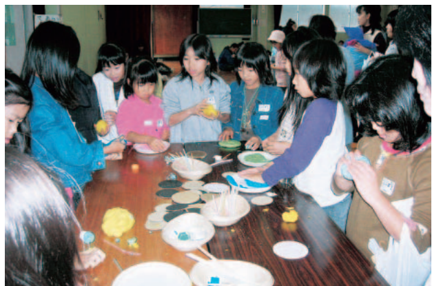
大人気の小麦粉粘土青や緑、黄など色もあざやか

参加した小学生の子どもたちは、「折り染めがキレイにできたよ」と言って、次の日学校に嬉しそうに持ってきたそうです。また、親子で参加された保護者が「先生たちもがんばってる