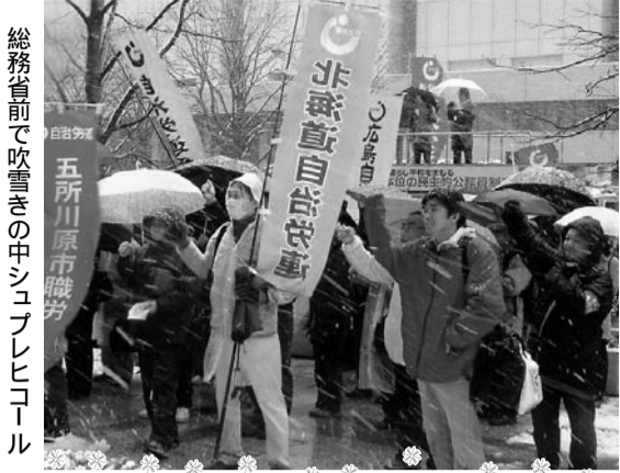
総務省前で吹雪きの中シユブレヒコール 大雪の東京 づいづい 極寒の中、春闘総行動

公務・民間組合、青年・女性・パート労働者が総結集する「05春闘勝利3・4総行動」が、都内各所で展開され、官民共同の総決起集会には、5000人の仲間が結集しました。昼過ぎまで雪が降り続く天候でしたが、全国から集まった参加者は、人事院や総務省への要請行動、集会、国会請願デモで大奮闘しました。