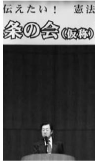
憲法 九条の会 (愛知)

川空襲で26分間に3256発の爆弾が落とされ、豊川海軍工廠の学徒生452人が死亡。当時の日本の平均