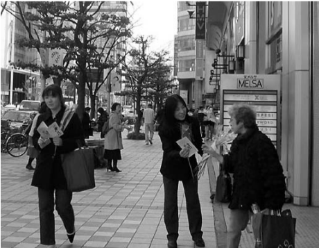
ガーベラの花と憲法ティッシュやリーフを配る女性部組合員

「憲法9条を守りましょう」と声かけしながら配布しました。特にガーベラの花やティッシュは人気がありわずか40分でなくなるほどでした。宣伝の4日後、「一本のお花から優しい心をいただきました」とメッセージが添えられた署名八ガキが県本部に届けられました。