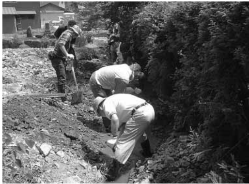
36度の猛暑の中で「土砂で埋まった側溝の復旧作業」