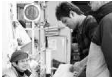
「くらしていくのが大変なのに食品にも消費税なんて」

「8%増税もだけど10%増税なんて絶対くい止めなくちゃ」と語るのは古くからクリーニング屋を夫婦で営む女将さん。増税なら値上げせざるを得ないが、それでは料金の安い大手にお客を取られてしまうといいます。「1枚50円の違いでもお客さんにしてみれば、1ヶ月、1年と積み重なって大きな金額。娘や孫のためにお金を残してあげたい。でも、貯金なんて今はとても無理なんです」と経営の厳しさを語ります。訪問したメンバーが、ア