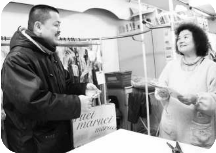
「増税なんて絶対食い止めなくちゃ」と語るクリーニング屋の女将さん

労を中心としたメンバーが訪問したのは名古屋市西区にある円頓寺(えんどうじ)商店街。名古屋の下町商店街として古くから栄える場所です。そこでメンバーを待っていたのは、「お客さんのためにも増税分を商品価格に転嫁はできない。結