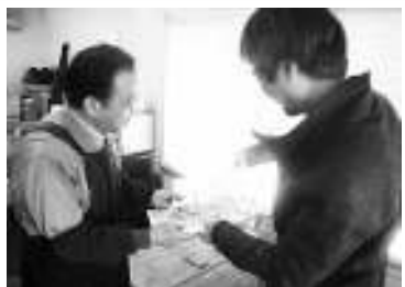
中小企業の実情を対話で確認

2月11日、トヨタ総行動がとりくまれました。豊田市にある本社前とグループ企業が集中す