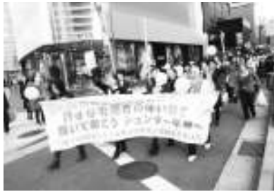
名古屋駅前を元気にデモ行進

「思っていることと形にできた」 新たな仲間と要求書づくり 県本部青年集会「身も心もほっこりツアー」に蒲郡を11月9日(土)～10日(日)、蒲郡市・三谷温泉「平野屋」で開催。全県から13単組112名が参加し、学習と交流を深めました。