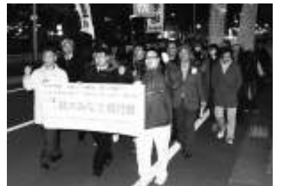
くらしの改善求めてパレード

また、春の総行動で行政との懇談もある旨を伝えると「ぜひ一緒に参加したい」と手を上げてくれました。その他にも「公園の地下に雨水貯留施設をつくらせてほしい」「車を移動させる場所がない」など多くの住民から切実な声が集まりました。