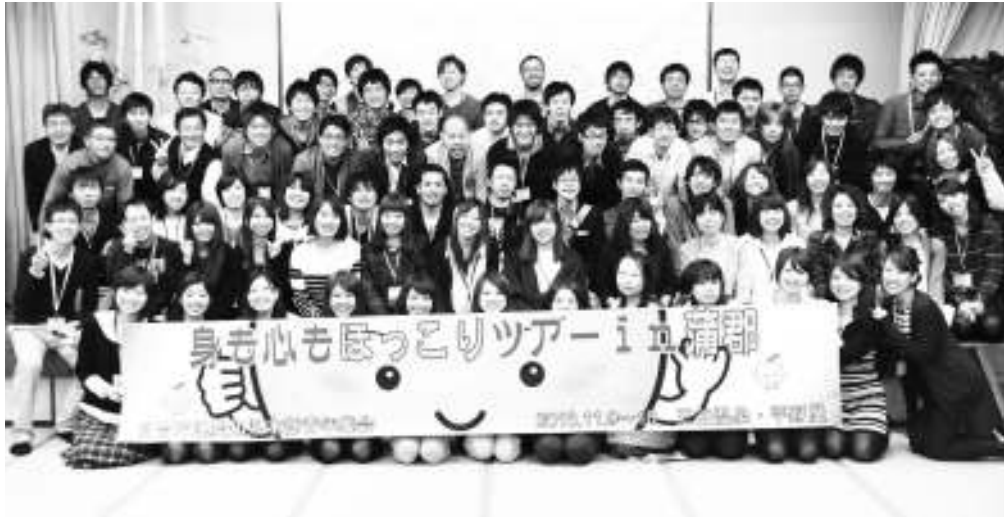
ほっこりツアーの最後に仲良くなった仲間みんなで記念撮影

「思っていることと形にできた」 新たな仲間と要求書づくり 県本部青年集会「身も心もほっこりツアー」に蒲郡を11月9日(土)～10日(日)、蒲郡市・三谷温泉「平野屋」で開催。全県から13単組112名が参加し、学習と交流を深めました。