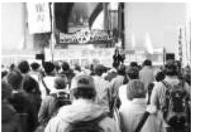
若宮広場で脱原発を訴え