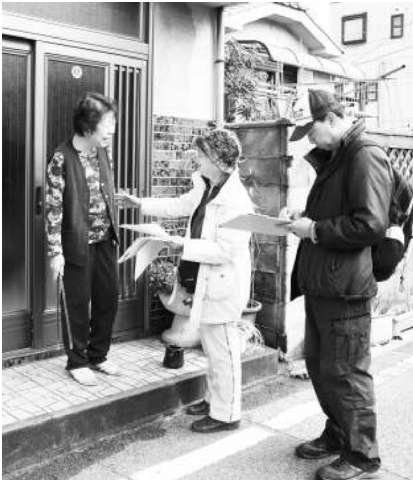
浸水被害のあった地区を訪問し防災アンケートにとりくみました