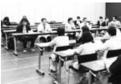
豊川市職労の交渉の様子

役員だけでなく、当該の要求を持った組合員を先頭に、全組合員の怒りを結集したとりくみが最終盤で重要となっています。一方的な改悪を許さないとりくみを強め、労使の協議をつくして要求実現をめざしましょう。