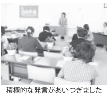
積極的な発言があいつぎました

みんなで話し合っ、働きやすい職場をつくろうと、自治体一般安城ヘルパー分会の総会が5月19日、安城総合福祉センターで