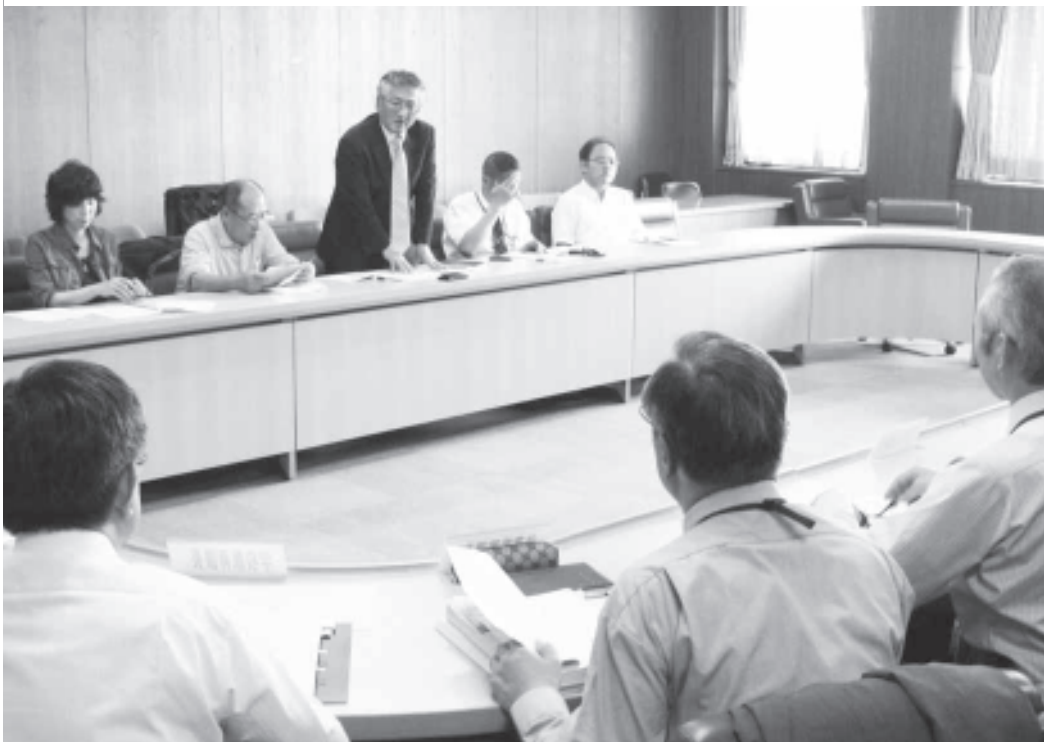
「公務員賃金の引き下げ反対」を含む、はたらく者の権利などについて自治体と懇談