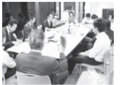
体験の辛さを語り合いました

参加者からは「今日学んだことを明日からすぐに子どもたちとやってみたい」「他の園の方と意見を出し合えてとても良かった」など感想がよせられています。