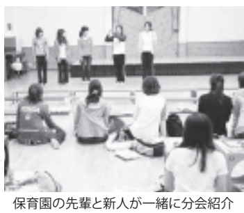
保育園の先輩と新人と一緒に分会紹介

清須市職労は5月21日、新人歓迎会を実施しました。先輩と新人合わせて20人以上が参加し、保育園ごとの分会や女性部などの専門部を紹介。賃金削減問題の学習会も開かれました。