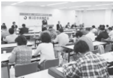
夏季闘争方針を確認

まばらだったビラの受け取りも、日を迫うごとに良くなるなど職員の意識が高まりました。そして4月22日に人事課に対して賃下げ反対の申し入れを行い、「職員のモチベーションが下がることであり、できればやりたくない。ただ今後の状況によって変わることもある」と見解