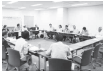
第5分科会「人間性が開花する地域づくり」

「生かそう憲法、いのちと暮らしを守る自治体に」をスローガンに5月20日、第39回東海自治体学校が刈谷市産業振興センターで開催されました。