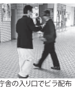
庁舎の入り口でビラ配布

まばらだったビラの受け取りも、日を迫うごとに良くなるなど職員の意識が高まりました。そして4月22日に人事課に対して賃下げ反対の申し入れを行い、「職員のモチベーションが下がることであり、できればやりたくない。ただ今後の状況によって変わることもある」と見解