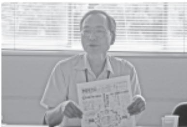
「学習を力に」で職場討議(半田)