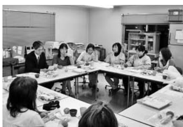
要求を語りあう幸田の臨時保育士

非正規職員の一時金・退職金を廃止し、賃金表を改定してきています。そのための職場オルグでは、「みんなが一時金を貰う時期には自分たちも欲しい」「夏季休暇は正規並みに欲しい」などの声が出されています。その声を受け市職はこの秋、非正規職員の「賃金の引き上げ」「労働条件の改善」「夏季休暇を正規並みに」「不当な雇止め禁止」「経験年数を加味した賃金決定」を求め、要求書を提出するなど、正規・非正規が一緒に運動をすすめています。