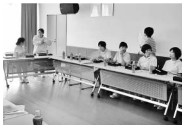
定例会につどう西尾のなかま

11月10日、東京・日比谷野外音楽堂で開かれた「諸要求実現11・10中央総決起集会」には全国から3千人が参加。大震災からの住民本位の復興、TPP参加反対、社会保障・大増税反対のシュプレヒコールを響かせました。集会後には、厚労省や財務省、経済産業省前で抗議行動。「原発ゼロへ」「消費税の大増税は許さないぞ」「賃上げ、社会保障の充実を」など切実な要求の実現を迫りました。 11日、名プロは本庁前で秋年末闘争決起集会を開催。「賃金カット許すな」などの要求を掲げ参加した千人の仲間は、雨雲も吹き飛ばす勢いを示しました。