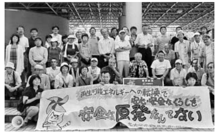
浜岡原発原子力館前で

浜岡原発の永久停止・廃炉を求め、静岡県大集会 7.23ひまわり集会 集会宣言（抜粋） 私たちは、東海地震の震源域の真上に建つ浜岡原発に危険と不安を感じてきましたが、福島第一原発の事故はその不安を現実のものとなりました。この事故によって、原発による生命と健康破壊の危険に加え、食糧・土・水・ふるさとなど、あらゆるものを汚染する放射能の恐ろしさを実感しています。浜岡原発から50km圏内には、214万人がくらしています。もし東海道メカトロの真ん中に位置する浜岡原発で事故が起これば、被害の甚大さ・深刻さははかりきれません。 地域や職場に「浜岡原発の永久停止・廃炉」のみんなの思いを束ね、つなぎあう「会」を無数につくりましょう。「浜岡原発の永久停止・廃炉」の署名を大きく広げましょう。被災地・避難地でがんばる東北の人々と心を通わせながら、今日この会場で確かめ合った「浜岡原発の永久停止・廃炉」への思いを、私たちのまわりに広げて、年内には浜岡に集まりましょう。以上、集会参加者の意志として確認し、宣言いたします。 2011年7月23日 「浜岡原発の永久停止・廃炉を求め、静岡県大集会」参加者一同