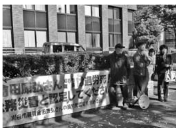
公判後の報告集会

自治労連共済の 火災共済は安い! 1口(耐火)保障額 2.5円/月で最高10万円