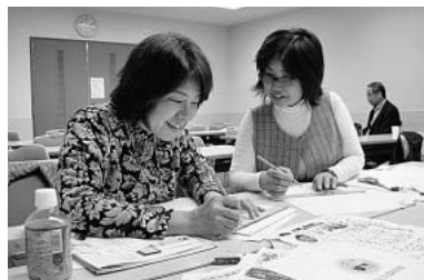
新聞づくりを実践で学ぶ参加者