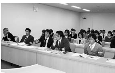
岩倉市職・総務部長交渉

11月10日に行われた瀬戸市職労の懇談会では、「自分たちの給料が高卒初任給より低いんだ」とおどろきの声。この懇談会を経て、17日に当局へ、「高卒初任給を最低限とした給与月額に抜本改善すること」「病気休暇、服喪休暇等の特別休暇(有給)を拡充すること」など5項目の要求書を提出しています。