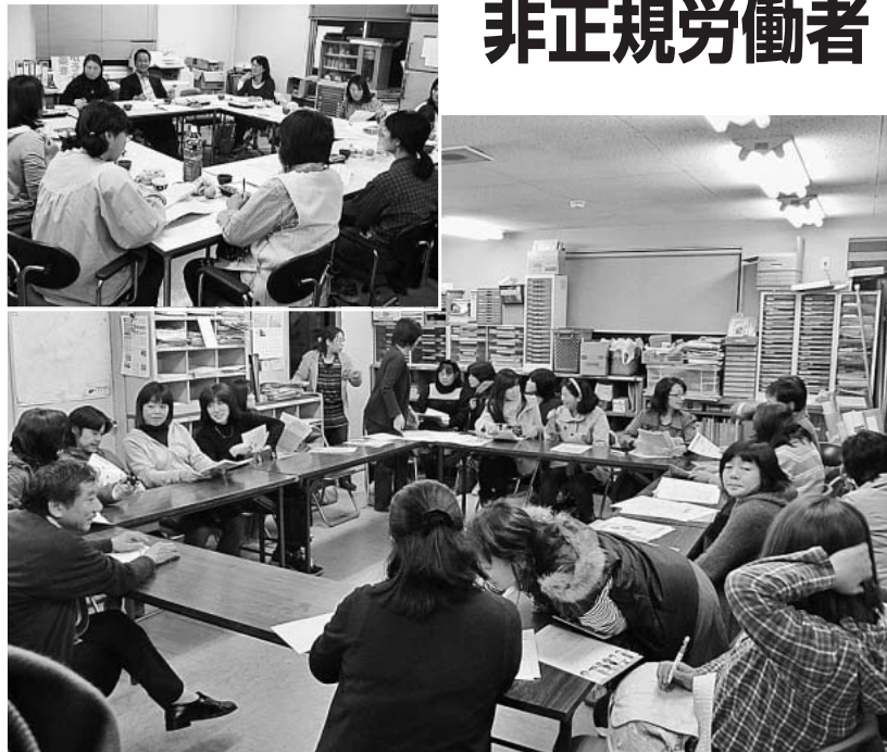
上：幸田町職労・下：瀬戸市職労 懇談会ではさまざまな思いが語られます。

県本部では、12月末までを秋の組織拡大月間と位置づけ、特に、非正規職員の組織化に重点を置いて、関連協役員による単組オルグや懇談会などさまざまな取り組みをすすめています。これまでに86人の新たな組合員が加入。今年5月に結成された水道検針員労組では、組合加入がすすみ1000人を超え、学事労では、10月の分会長会議で、すべての分会で6割の達成をめざすことを意思統一しています。