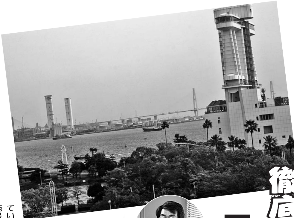
県民には何も知らされないまま中枢港湾構想計画がすすめられる名古屋港

ていました。しかし、今は施設料を格安にしている、シンガポール・上海・香港・釜山にまわり、日本への寄港は減少しています。こうした競争に勝とうと、国土交通省は昨年10月、徹底したコスト削減と船舶の大型化に対応する港湾づくりをすすめるとして、国内1~2カ所の港を集中整備し、「ハイパー中枢港湾」にするとしています。