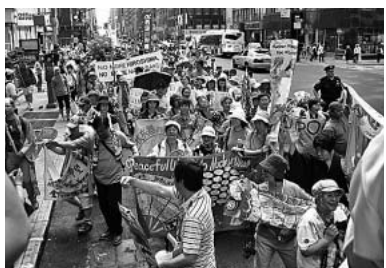
マンハッタンをパレード

5月3日からスタートした核不拡散条約(NPT)再検討会議。核保有国に核兵器廃絶の約束を再確認さ