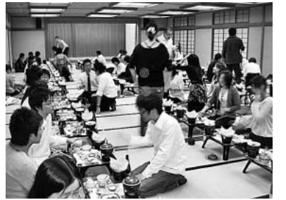
あわせて81人が参加。

「多くの人が組合に加入し職場の要求実現を目指しましょう」と書記長があいさつ。チームごとに分かれてゲーム形式の自己紹介。