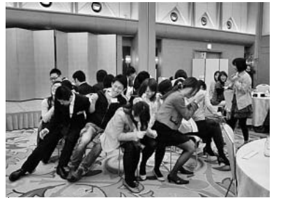
①長久手町職労、②犬山市職労、③蒲郡市職、の学習会・歓迎会

「多くの人が組合に加入し職場の要求実現を目指しましょう」と書記長があいさつ。チームごとに分かれてゲーム形式の自己紹介。