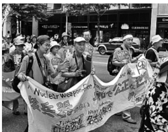
名古屋市職労の参加者