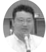
加納代議員 (港財団職員)

財団が統合して港財団職 員労働組合になり、60人の 職員が100人となり、75 %が組合加入するまでに なった。指定管理者制度の 該当団体になっている。指 定管理者を受けられなけれ ば、大変なことになる。港 職労とも連絡を密に取りな がら活動をすすめていき