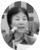
柿内中央委員 (新川町職員)

財団が統合して港財団職 員労働組合になり、60人の 職員が100人となり、75 %が組合加入するまでに なった。指定管理者制度の 該当団体になっている。指 定管理者を受けられなけれ ば、大変なことになる。港 職労とも連絡を密に取りな がら活動をすすめていき