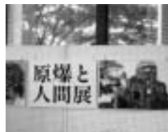
(上) 知立市内を平和行進 (下) 知立市役所の原爆パネル展示

6月3日は愛知入りして4日目。知立市役所から刈谷市役所まで12kmのコースを150人が行進に参加しました。沿道募