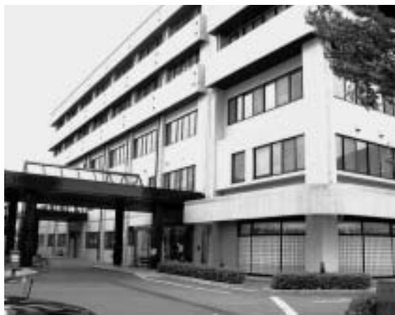
木曽川町職員の組合員が働く木曽川町立病院