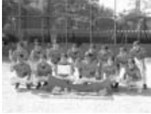
優勝した名古屋市職労チーム

6月5日、第26回自治労連愛知大会ソフトボール大会が尾張旭市のスポーツセンターで開催され、6チームが参