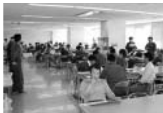
時間内職場集会で決議文を採択(名古屋市職労・環境局支部南分会)

4・15年金制度改悪反対の全国統一行動に自治労連愛知の29の組合が多彩なとりくみで参加。早朝時間内職場集会に名古屋市職労、名水労、港職労が取り組み、豊橋市職労も本庁前の早朝集会に400名が参加。昼休み集会も5単組の本庁・病院・水道などの職場で開かれました。半田市職の病院支部では、