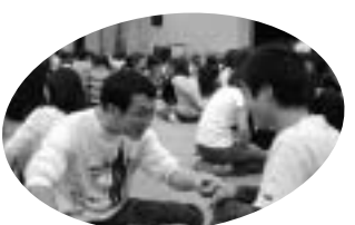
男性保育士もたくさん参加

「新規の保育士です。あまり期待してなかったのに、すごく楽しくてよかったです」日々の保育を振り返ってみようと思いましたが、「同じ年齢を受け持つ人の話が聞けたんだかホッとしました。みんな同じなんだなあと安心しました。」などの感想が寄せられました。