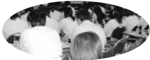
年金ビデオを見ながら2回に分けた昼休み集会に102名が参加(半田)

4・15年金制度改悪反対の全国統一行動に自治労連愛知の29の組合が多彩なとりくみで参加。早朝時間内職場集会に名古屋市職労、名水労、港職労が取り組み、豊橋市職労も本庁前の早朝集会に400名が参加。昼休み集会も5単組の本庁・病院・水道などの職場で開かれました。半田市職の病院支部では、