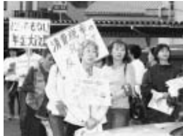
大山市役所前で地域集会を夕方開催し、100名が参加。その後市内をデモ行進してアピールしました