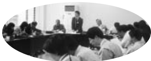
新入組合員も含め30名が昼休み集会に参加(武豊)