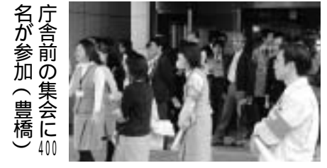
庁舎前の集会に400名が参加(豊橋)

12時からと、12時半から年金ビデオを上映。「ザ・ニュースペーパー」のコントに笑い声がおこるなど、年金改悪の中身がよく分かったと好評でした。退庁集会も5単組で開催されました。また、学習会や執行委員会なども開催され、年金学習会や執行委員会決議の採択も行われました。地域や駅頭、庁舎前な