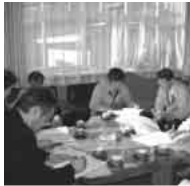
愛知と静岡の県境「富山村」に介護・医療・福祉の充実を求めるキャラバン隊

10月14日から17日にかけて2003年愛知自治体キャラバンが行われました。これは愛知県社会保障推進協議会、愛知県労働組合総連合、自治体連愛知県本部、新日本婦人の会愛知県本部の4団体を中心に「医療・介護・福祉など社会保障の充実とくらしを守る」自治体キャラバンとして県下87の市町村（名古屋を除く）を訪問要請しました。介護保険料・利用料の減免制度の実施や高齢者医療の充実、子育て支援策として就学前までの医療費無料制度の実施や国民健康保険の改善を求める内容で行われました。各市町村で財政