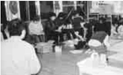
新川町職労全員学習会 議・労使合意での決着をもとに議会上程を図ることを前面に交渉に臨みます。