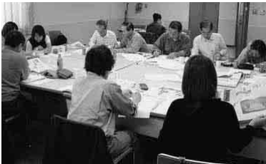
昨年の実践講座参加者

愛労連と自治労連がとりくむ第8回機関紙・宣伝学校が今年も開催されます。教宣担当になったけど機関紙やチラシづくりの基本や技術など人知れず悩みながら作っている担当者も少なくないと思われま。こうした苦労や悩みに応え、読まれる待たれる新聞や効果的な宣伝物作成をめざして学習し