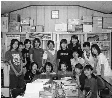
組合事務所に集まる保育所部会のみなさん

また、地方独立行政法人法の施行に向けて、身分が公務員でなくなり、学極的自治体リストラ。清掃学校調理・保育園など現場がねらわれる。市民病院も宣言でこそという考えをもって臨むことが大切」と指摘しました。同時に自治労連大会都市職部会で全国の厳しい攻撃の話にふれ、自治体財 市民病院が 攻撃の矢面に 最後に今年の確定の決着は半月ほど早まることになる。西尾の独自課題にラスパイレース指数九八・四を引上げさせるが、退職金見直し問題も確定で決着することになる。組合を大きくして賃金・労働条件等守るとりくみをしていこう。組合員一人ひとりが職場点検しながら組合に団結して運動していって呼びかけまし