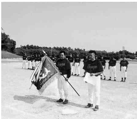
4年ぶりの優勝を決めた名古屋市職労チーム